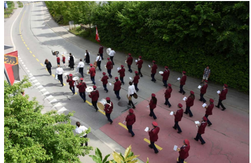
Musikverein Erlenbach-Diemtigtal am Mittelländischen Musiktag in Frauenkappelen am 26.05.2018

spielende Marsch bekannt gegeben. Die Beurteilung wird ebenfalls von drei Juroren vorgenommen. Der Erste bewertet die Präsentation, den Abmarsch, die Parade sowie die Musik, der für den Mittelteil Zuständige beurteilt die Musik und die Parade während der letzte noch zusätzlich die Schlussphase benotet. Auch hier kann wieder ein Punktemaximum von 300 Punkten erreicht werden.