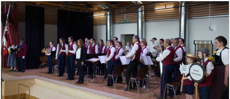
Musikverein Erlenbach-Diemtigtal am Mittelländischen Musiktag in Frauenkappelen am 26.05.2018

Temperaturen genossen wir ein wunderbares Fest. Als Vorbereitung auf den Oberländischen Musiktag liessen wir uns beraten. Die Tipps nahmen wir für den Schlussspurt gerne entgegen. Am 16.6. trafen wir uns in Steffisburg zum Musiktag. Die Konzertvorträge „Odilia“ und „Terra di Montagne“ gelangen uns vortrefflich. Trotzdem hatten wir unserer Ansicht nach nicht alles gezeigt, was möglich gewesen wäre. Wir wurden mit dem sehr guten 2. Rang belohnt, dieses Resultat feierten wir bis in die Nacht hinein. Am 22.6. spielten wir in der Arena der Sekundarschule Erlenbach unser Sommerkonzert zusammen mit der Jugendmusik Erlenbach-Diemtigtal. Leider fanden nur wenige Zuhörerinnen und Zuhörer den Weg in die Arena. Eine Woche später wurde uns die grosse Ehre zuteil zum 50-jährigen Jubiläum der