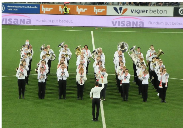
Musizierende aus dem Niedersimmental in der Stockhorn Arena Thun am 22.09.2018