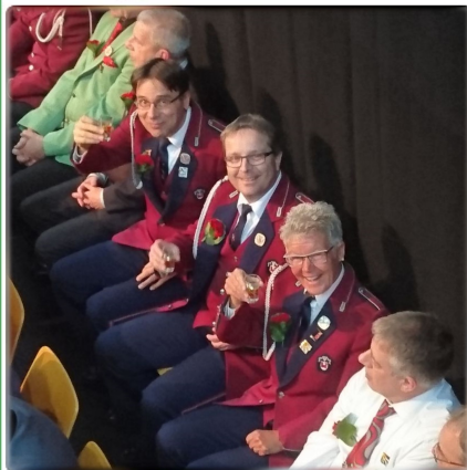
Üsi Veteranen 🤗🎉