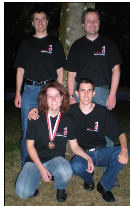
Wir sind stolz auf euch.

Wir gratulieren zu der gelungenen Leistung ganz herzlich.