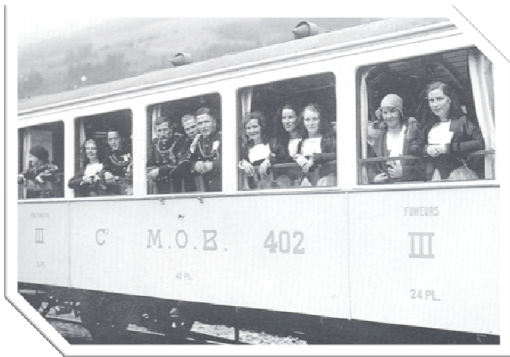
Oberländischer Musiktag an der Lenk 1934