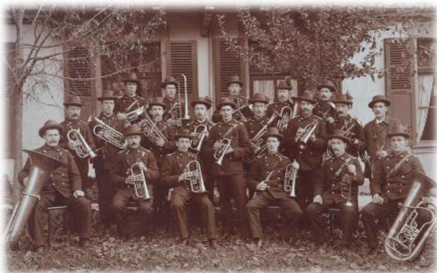
MG Erlenbach 1905