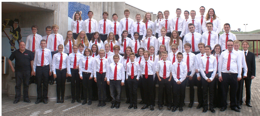
Jugendblasorchester unteres Simmental 31. Oktober 2015